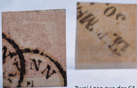
Zwei Lose aus der 61. Auktion.

Einlieferung in unsere Auktionen oder Direktverkauf gegen Barzahlung.