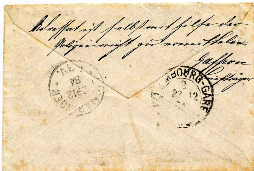
Abb. 2: Rückseite des Briefes, inklusive Vermerk des Briefträgers Gaffron: „Adressat ist selbst mit hilfe der Polizei nicht zu ermitteln“.