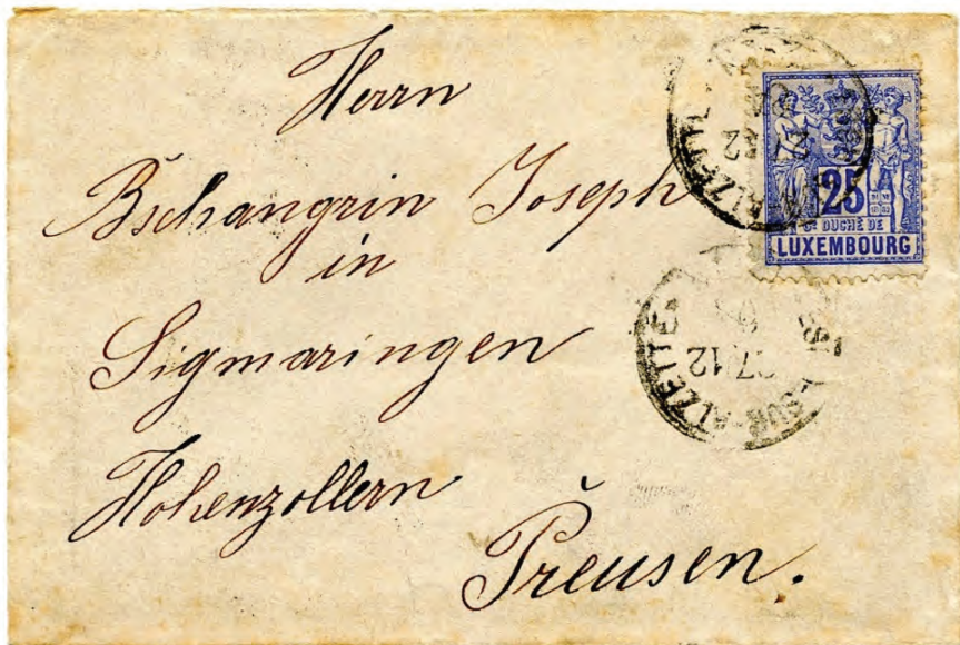
Abb. 1: Brief aus Esch-sur-Alzette in die preußische Exklave Sigmaringen / Hohenzollern vom 27. Dezember 1884 – als Destination nicht häufig.