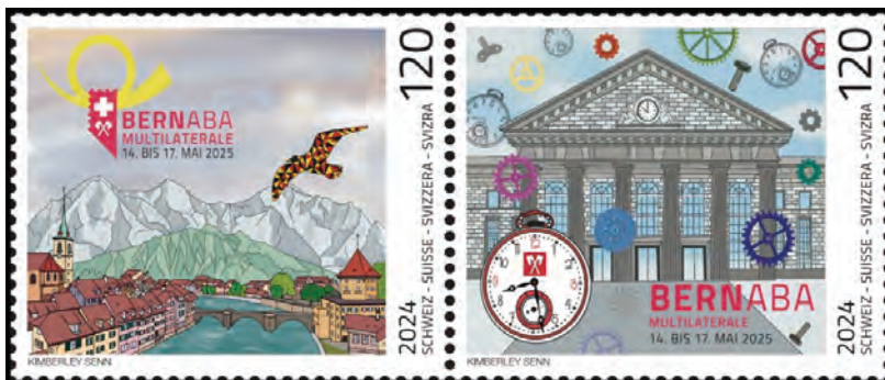
Die zweite Ausgabe der „Firmenmarken“ zur BERNABA von 2024

Da die Ausstellungshalle groß ist und genügend Ausstellungsrahmen zur Verfügung stehen, konnten alle gemeldeten und qualifizierten 220 Exponate mit 1131 Rahmen angenommen werden. Das heißt, 98 Exponate = 45% für die Multilaterale und 122 Exponate = 55% für die Nationale Ausstellung.